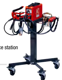
Optional mobile service station